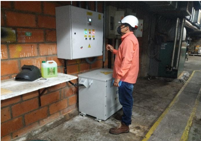
Inspección situación equipos reportados en falla