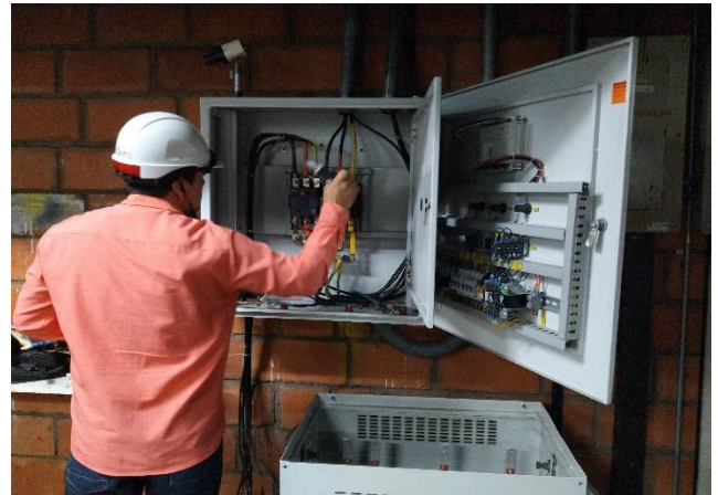
Revisión sistema de transferencia automática