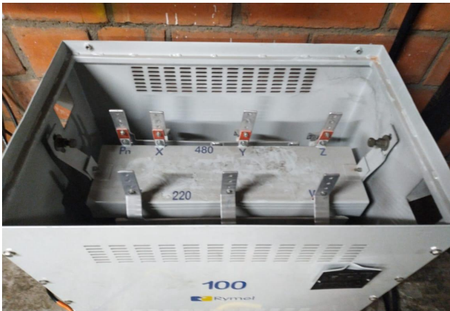
Apertura transformador 100 KVA 220/480 V del sistema de frío