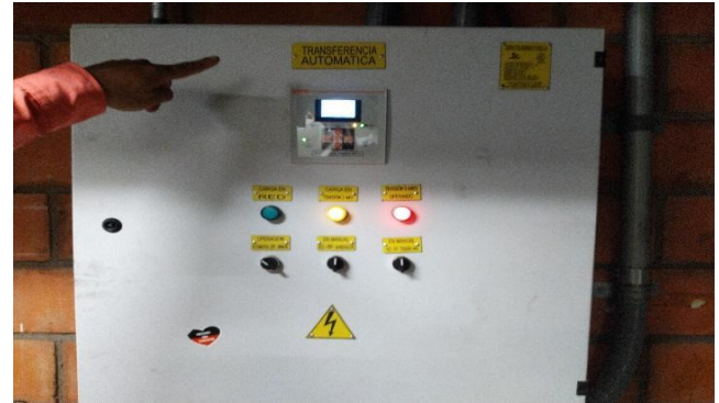
Restablecimiento del servicio con alimentación de suplencia