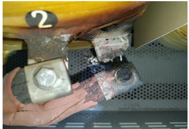
Terminal fallado por mal contacto, sin solución oportuna